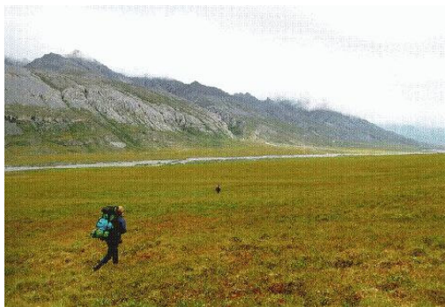
Een toendra in Lapland

De toendra's komen voor in Lapland ( dat is het noorden van Noorwegen, Zweden en Finland). Toendra's zijn vlaktes waar bijna niets groeit, alleen wat gras, mos en een enkele struik. Op de toendra's leven rendieren.