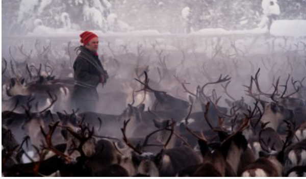
rendieren en een "Sami"