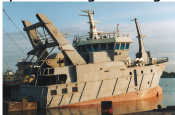
grote netten. Een vissersboot

Door de fjorden werken ook veel mensen in de visserij ( met name in Noorwegen). Op reusachtige boten gaan ze de Noordzee op en vangen de vis met