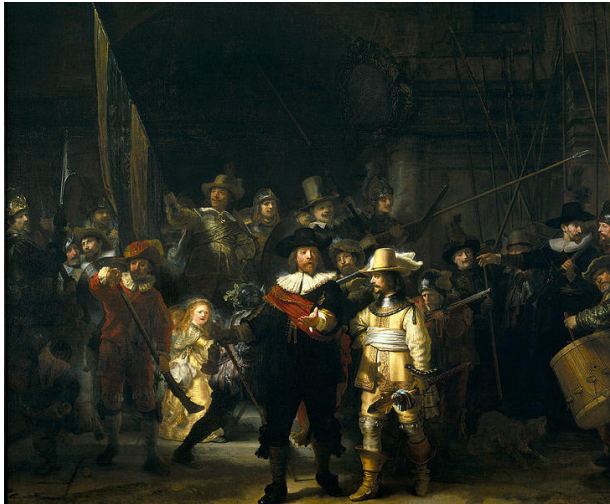
De Nachtwacht (1642 - collectie Rijksmuseum, Amsterdam)

De zeventiende eeuw (1600-1700) werd ook wel de Gouden Eeuw genoemd. De Gouden Eeuw was een periode waarin het erg goed ging met Nederland. Het ging goed met de schilderkunst b.v. Rembrandt van Rijn, met de handel (de VOC) en er waren beroemde wetenschappers en schrijvers zoals Christiaan Huygens, Antonie van Leeuwenhoek en Jacob Cats.