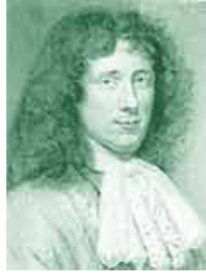
Christiaan Huygens (1629-1695)

Christiaan Huygens hield zich ook bezig met natuurkunde en sterrenkunde. Zo ontdekte hij de ringen rondom de planeet Saturnus.