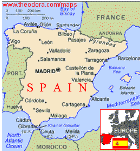
Straat van Gibraltar

Ook op het gebied van de handel ging het goed met de Republiek (Nederland). Straatvaart noemde men de handel met de landen rondom de Middellandse Zee. Om daar te komen moesten de schepen door de Straat van Gibraltar. Dat is een smalle doorgang tussen Spanje en Afrika.