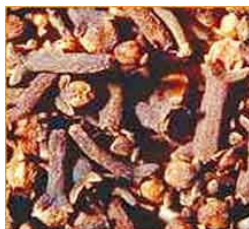
kruidnagel uit Ambon

De schepen werden Oost-Indiëvaarders genoemd. Ze voeren af en aan om producten te kopen en te verkopen. Op de heenreis hadden ze goud en zilver bij zich en ze kwamen terug met ladingen kruiden en specerijen.