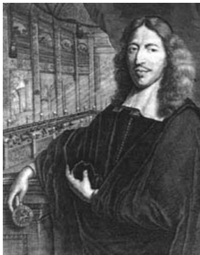
Johan de Witt

In 1672 vielen Engeland, Frankrijk, Munster en Keulen tegelijkertijd de Republiek aan. Het was weer oorlog. Daarom wordt 1672 het rampjaar genoemd. De stadhouder, prins Willem III leidde het leger. Op zee verliep de oorlog heel gunstig voor Nederland dankzij Admiraal de Ruyter. Maar op land ging het een stuk slechter. Het Franse leger drong diep het land binnen.