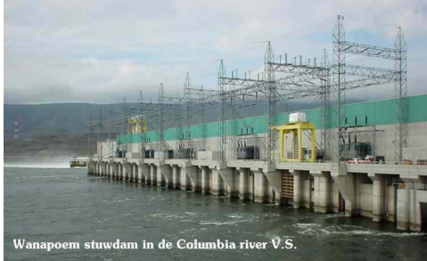
Wanapoem stuwdam in de Columbia river V.S.