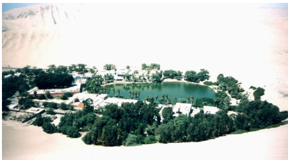
Een oase in de woestijn

In Noord-Afrika en het Midden-Oosten zijn veel woestijnen. De meeste mensen wonen bij een rivier, omdat we water nodig hebben om te leven (drinken, wassen). Zij voeren dan het water via kanaaltjes en sluisjes naar de akkers. Een plek met water in de woestijn noemen we oase. Bij een oase groeien veel dadelpalmen.