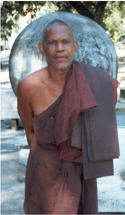
Een Boeddhistische monnik