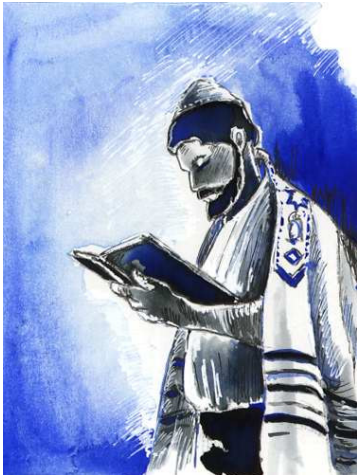
Een Joodse rabbi