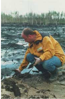
olie en ons milieu