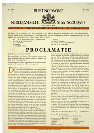
De Staatscourant: hier staan alle nieuwe wetten in.